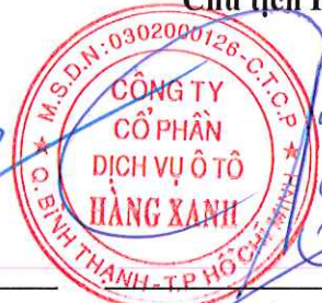
ĐỖ TIẾN DŨNG